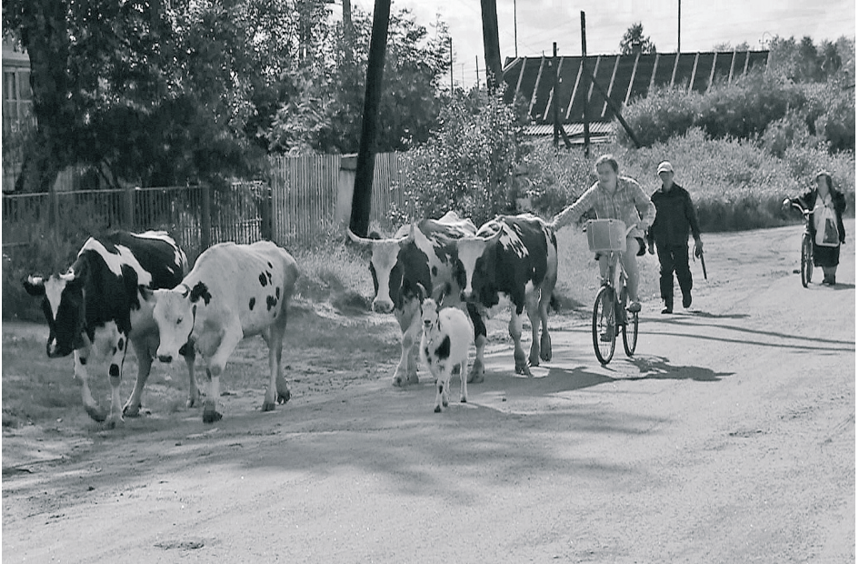
Repolan lehmiä Antikaisen kadulla matkalla laitumelta iltalypsylle